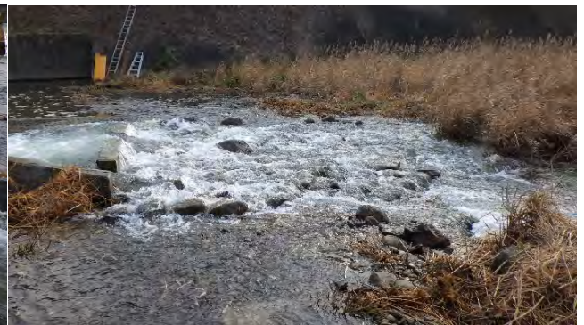
改善後の左岸側の魚道下流端の状態