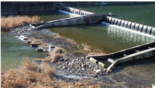
石組み施工完了直後の状態