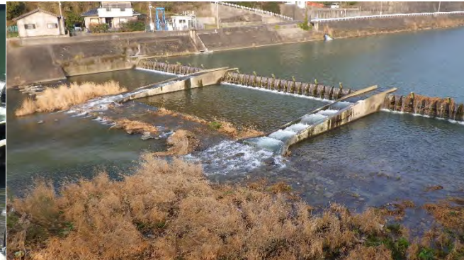
施工完了翌日の魚道に通水した状態