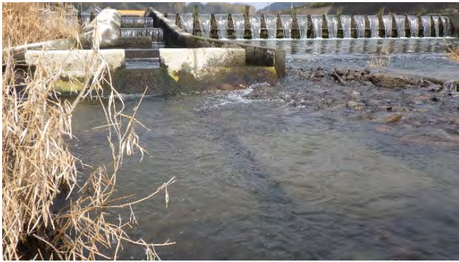
改善前の右岸側の魚道下流端の状態