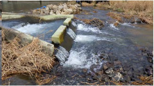
改善前の左岸側の魚道下流端の状態